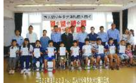
西入間少年少女消防団入団式