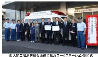
西入間広域消防組合派遣型救急ワークステーション調印式