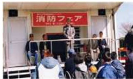
第1回消防フェアを開催