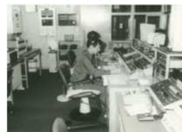
消防救急指令装置設置