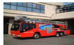
はしご付消防ポンプ自動車購入