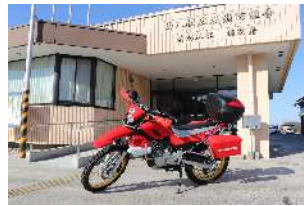
災害用バイク導入