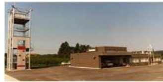
消防署鳩山分署訓練塔竣工