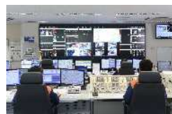
消防通信指令業務共同運用開始