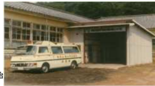
消防署仮鳩山分署