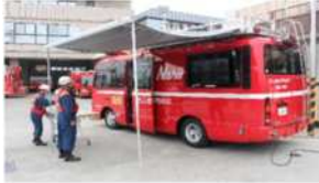
指揮支援車運用開始