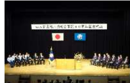
西入間広域消防組合開設40周年記念式典