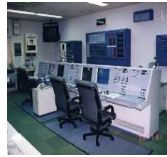
消防緊急通信指令施設更新