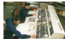
消防救急指令装置移設