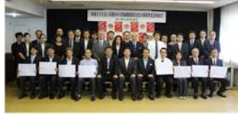
地域ささえあい自動体外式除細動器貸出協力事業者協定