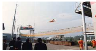
消防署訓練塔竣工