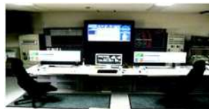
消防緊急通信指令装置更新