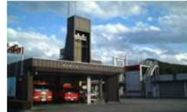
消防署越生分署竣工