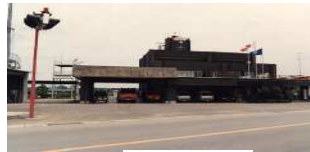
消防本部消防署庁舎竣工