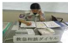
救急相談ダイヤル設置