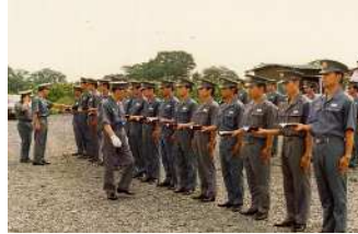
管理者による点検