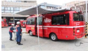
指揮支援車運用開始