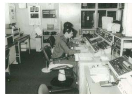
消防救急指令装置設置