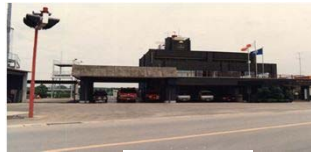
消防本部消防署庁舎竣工