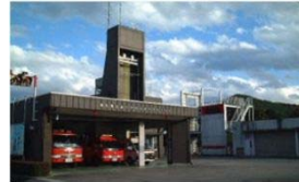
消防署越生分署竣工