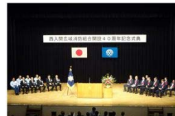
西入間広域消防組合開設40周年記念式典