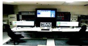
消防緊急通信指令装置更新