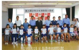
西入間少年少女消防団入団式