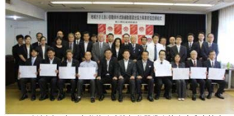
地域ささえあい自動体外式除細動器貸出協力事業者協定