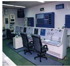
消防緊急通信指令施設更新