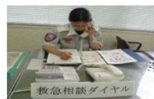
救急相談ダイヤル設置