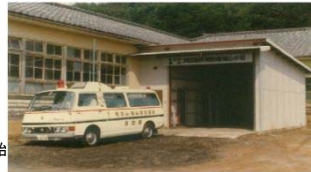
消防署 仮鳩山分署