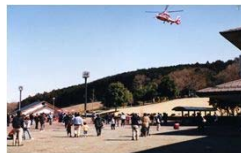
第1回消防フェアを開催