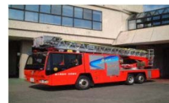
はしご付消防ポンプ自動車購入