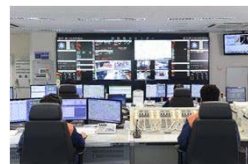
消防通信指令業務共同運用開始