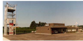
消防署鳩山分署訓練塔竣工