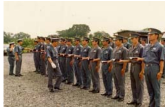
管理者による点検