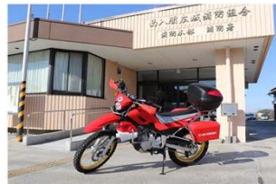
災害用バイク導入