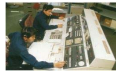
消防救急指令装置移設