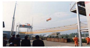
消防署訓練塔竣工